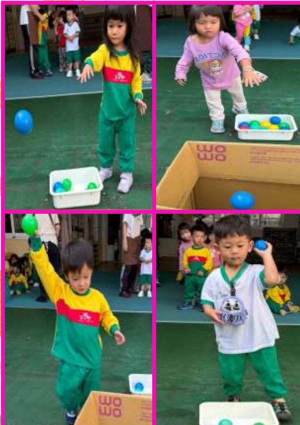
綜合體能競賽~投擲比賽