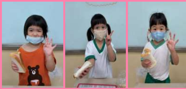
烹飪活動~草莓吐司