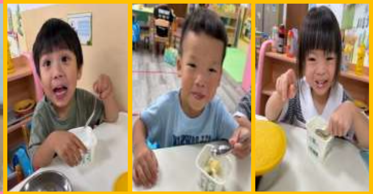
烹飪活動~水果優格