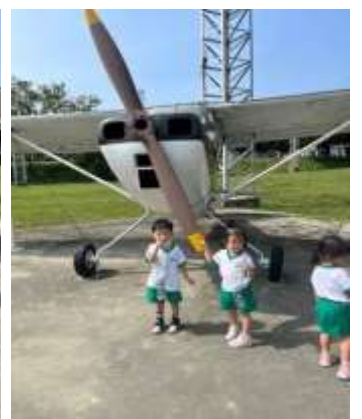
戶外教學~駁二棧貳庫&桃子園軍事器材公園