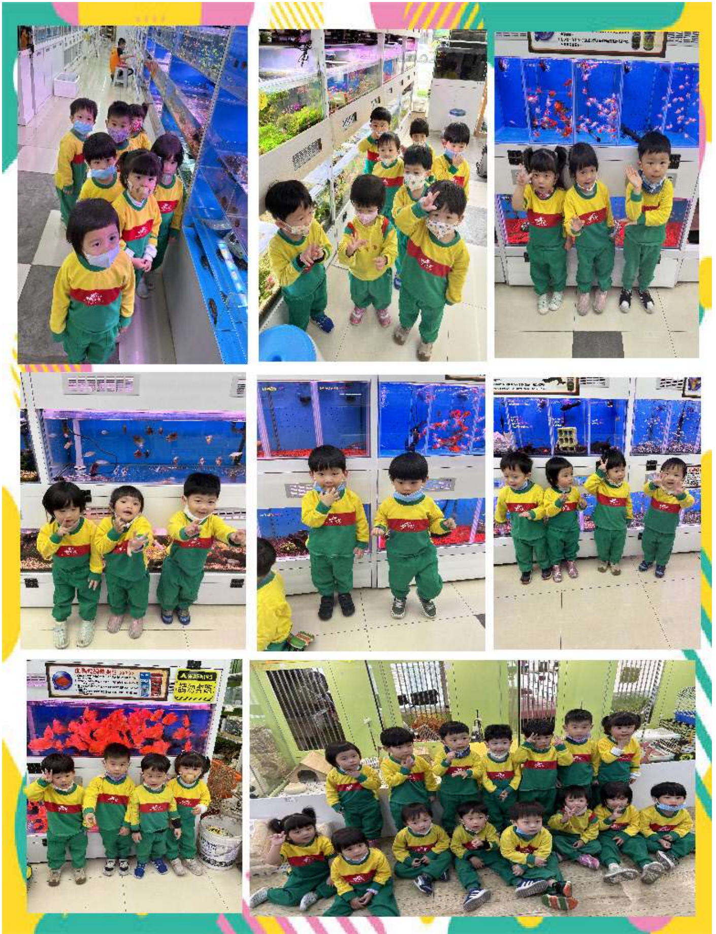
戶外教學~北高雄水族館